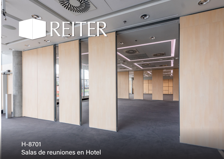
H-8701 Salas de reuniones en Hotel