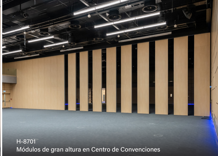
H-8701 Módulos de gran altura en Centro de Convenciones