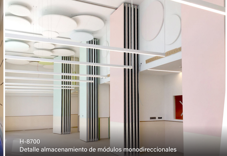
H-8700 Detalle almacenamiento de módulos monodireccionales