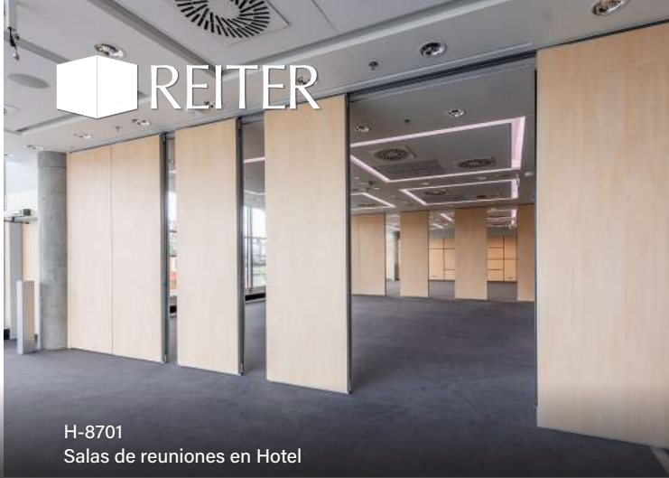
H-8701 Salas de reuniones en Hotel