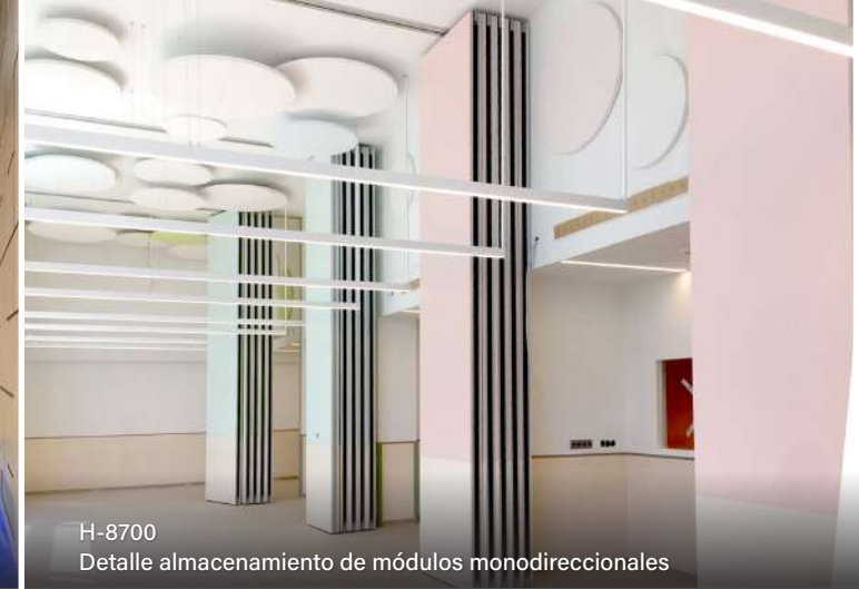
H-8700 Detalle almacenamiento de módulos monodireccionales