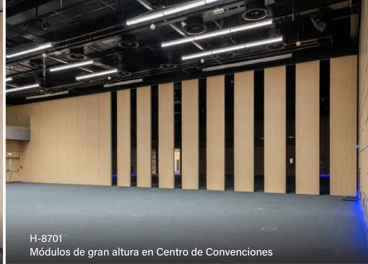
H-8701 Módulos de gran altura en Centro de Convenciones